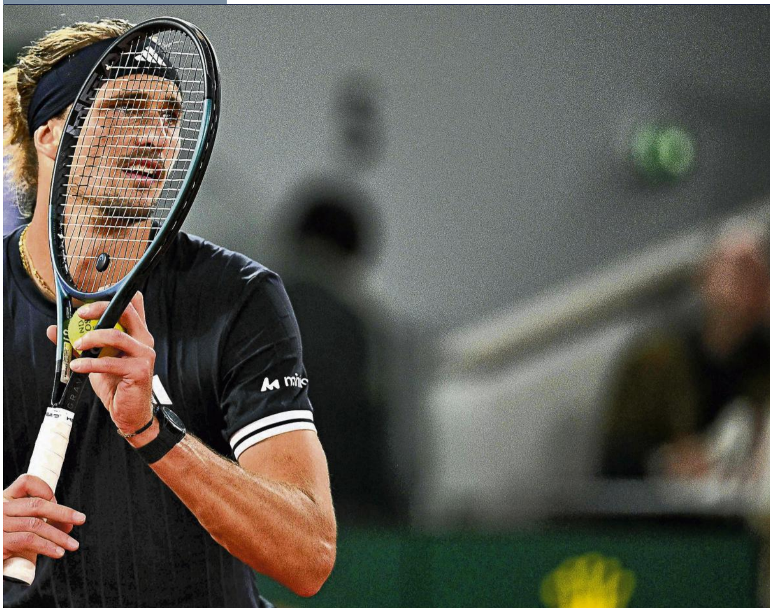
Alexander Zverev hat das Halbfinale der French Open erreicht und darf weiter von seinem ersten Grand-Slam-Sieg träumen. Der Deutsche ließ sich am Dienstag nicht vom spanischen Shootingstar Rafael Nadal aufhalten und setzte sich mit 7:6 (7:3), 6:1, 6:3 durch.