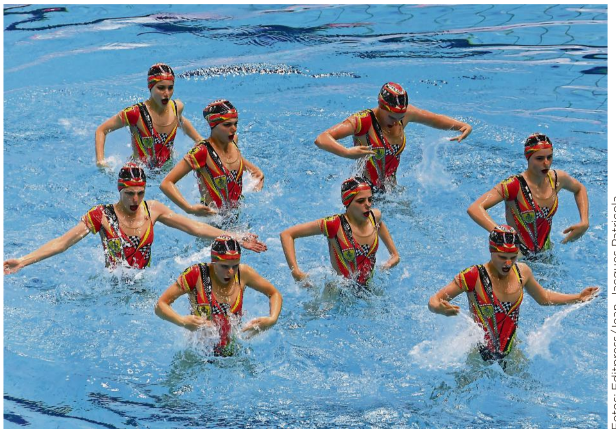
Luxemburgs Programm stand unter dem Motto „Motorsport“