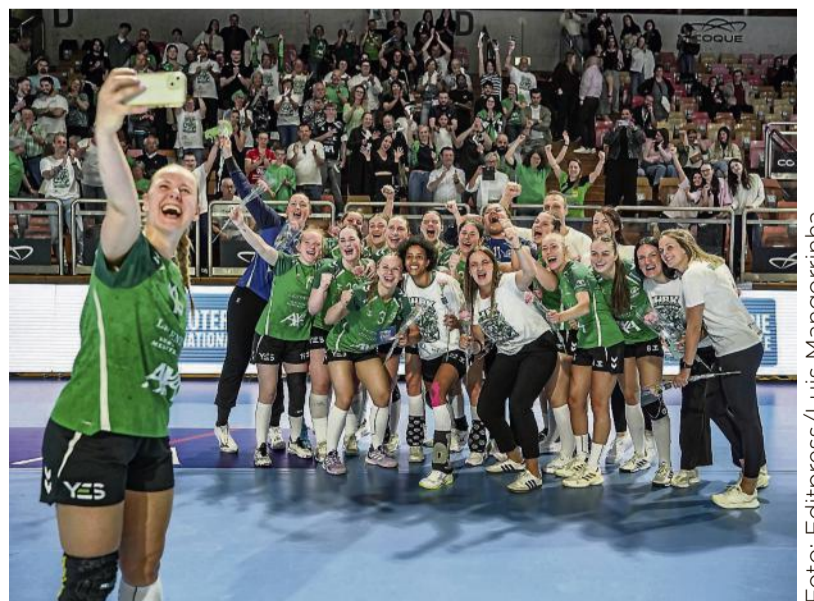
Das Käerjenger Damenteam spielte eine starke Saison, macht den Pokal

Spendenaufrufs deutlich: „Ohne zusätzliche Unterstützung droht unserem Verein die Liquidation.“ Das hätte weitreichende Folgen: „Keine sportlichen Aktivitäten mehr, kein Handball mehr für unsere Jugend, kein Treffpunkt mehr für 250 Menschen – das Ende eines Vereins, der für viele ein echtes Zuhause ist.“ Bis Montagmorgen kamen bereits mehr als 12.000 Euro zusammen. Im Spendenaufruf heißt es weiter: „Jeder Beitrag – auch der kleinste – hilft uns, dieses Ziel zu erreichen und unseren Verein zu retten.“