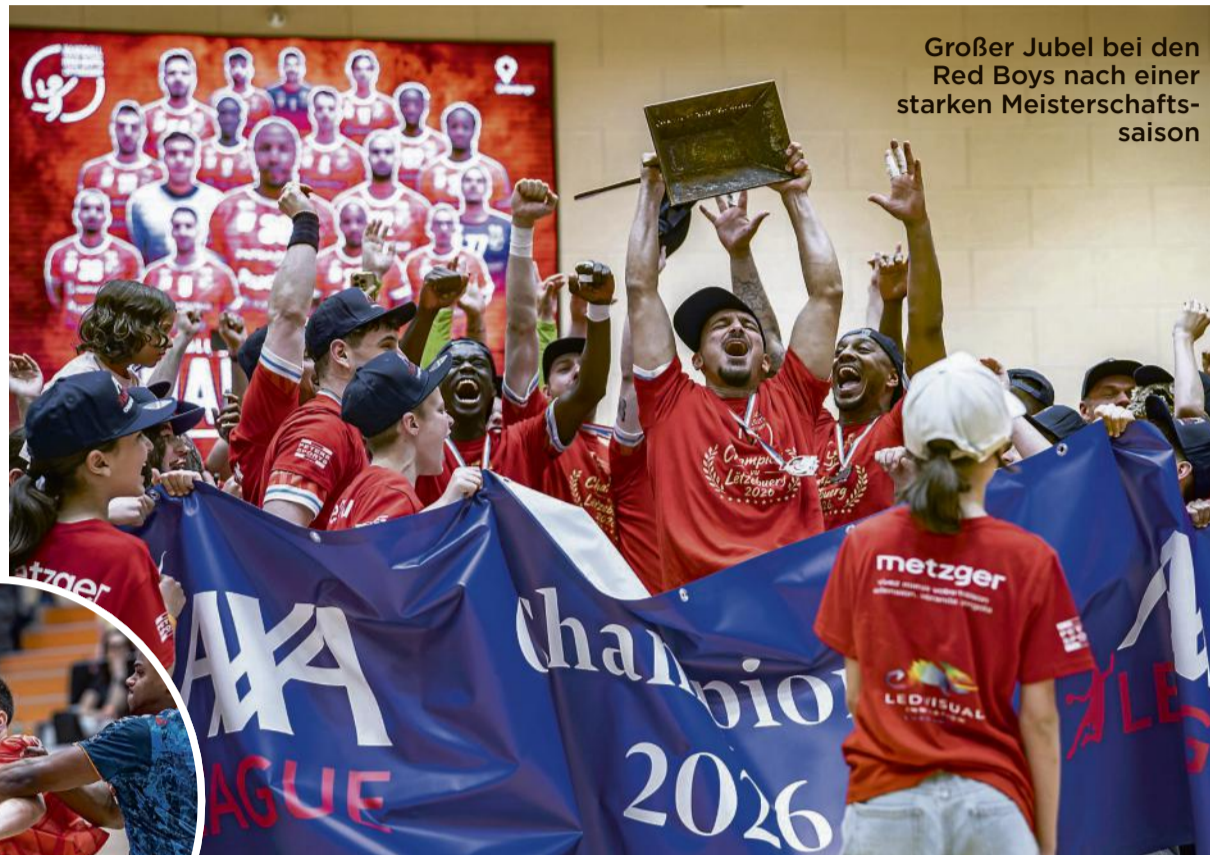
Großer Jubel bei den Red Boys nach einer starken Meisterschaftsaison

Die Partie zwischen den beiden besten Mannschaften begann zunächst mit Vorteilen für die Gäste aus Düdelingen. Torwart Mika