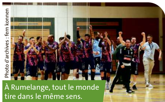
À Rumelange, tout le monde tire dans le même sens.