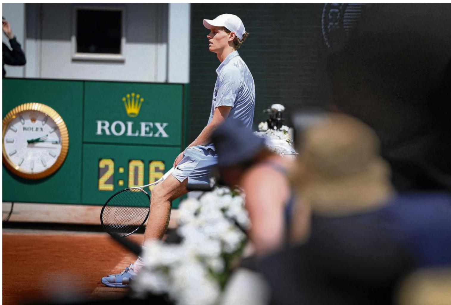
Die Hitze von Paris sorgte für das dramatische Aus des Weltranglisten-Ersten Jannik Sinner