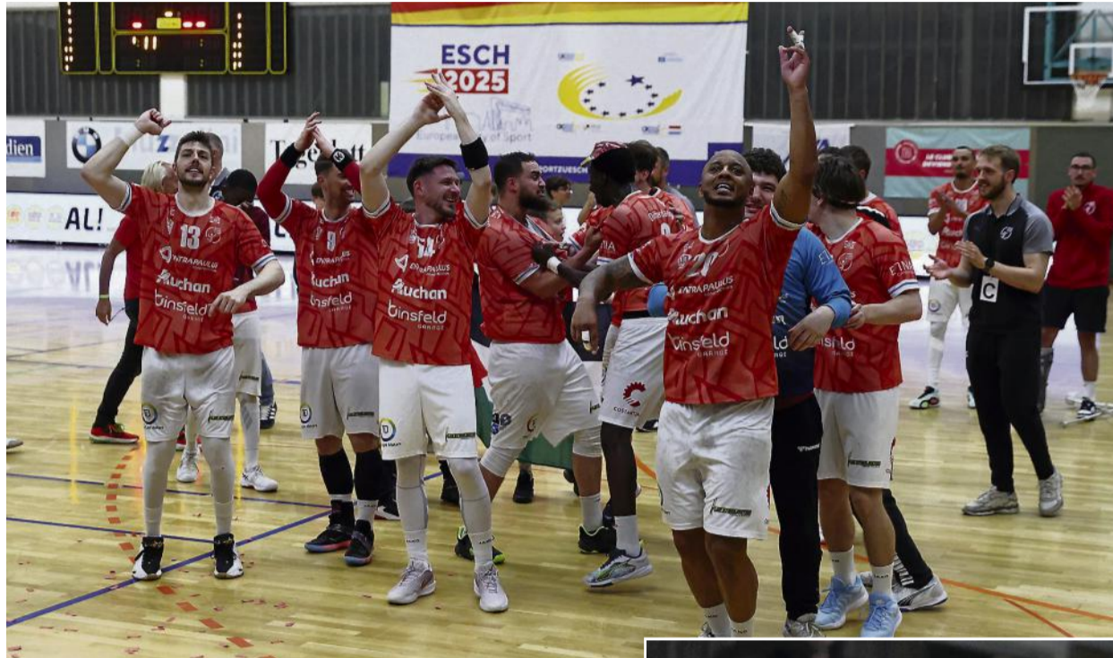
Die Red Boys feiern die Titelverteidigung

Der entscheidende Erfolg in Esch war allerdings alles andere als ein Selbstläufer. Die Escher waren fest entschlossen, sich mit einem Prestigesieg gegen den amtierenden Meister für ihre bislang erfolglosen Duelle in dieser Saison zu revanchieren. Entsprechend engagiert startete der frischgebackene Pokalsieger in die Partie und lag früh zweimal mit zwei Toren vorne – zunächst 2:0 (3') und später 7:5 (12').