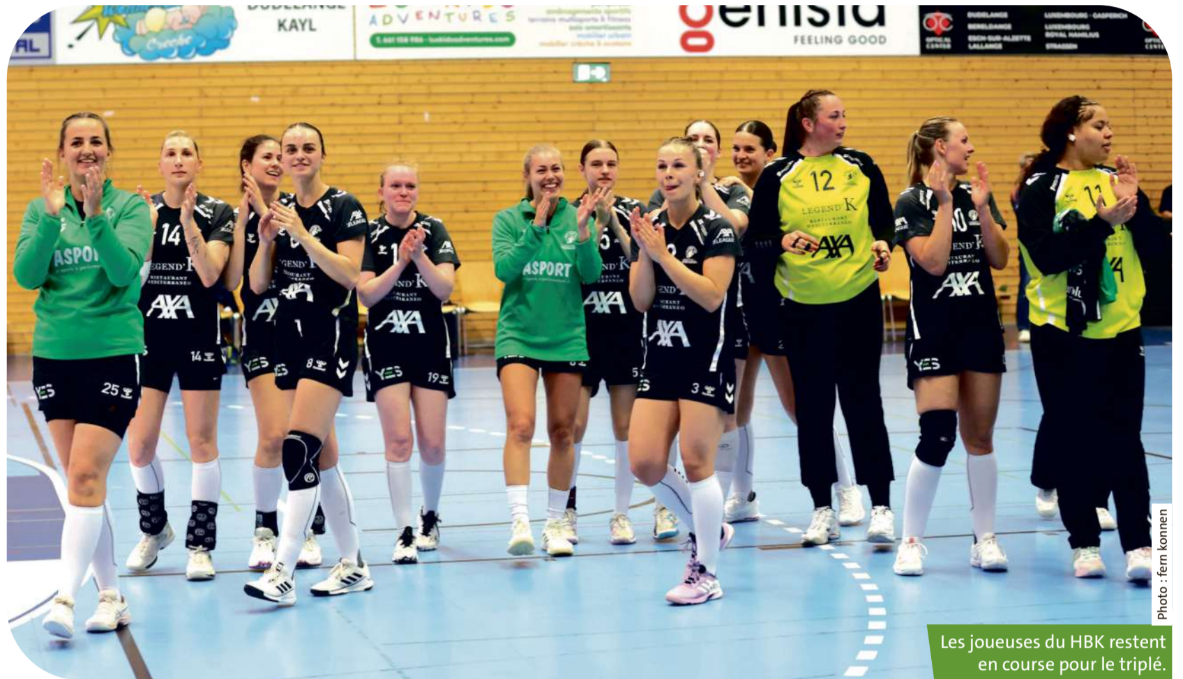
Les joueuses du HBK restent en course pour le triplé.

Moment choisi par les protégées de Mikel Molitor pour