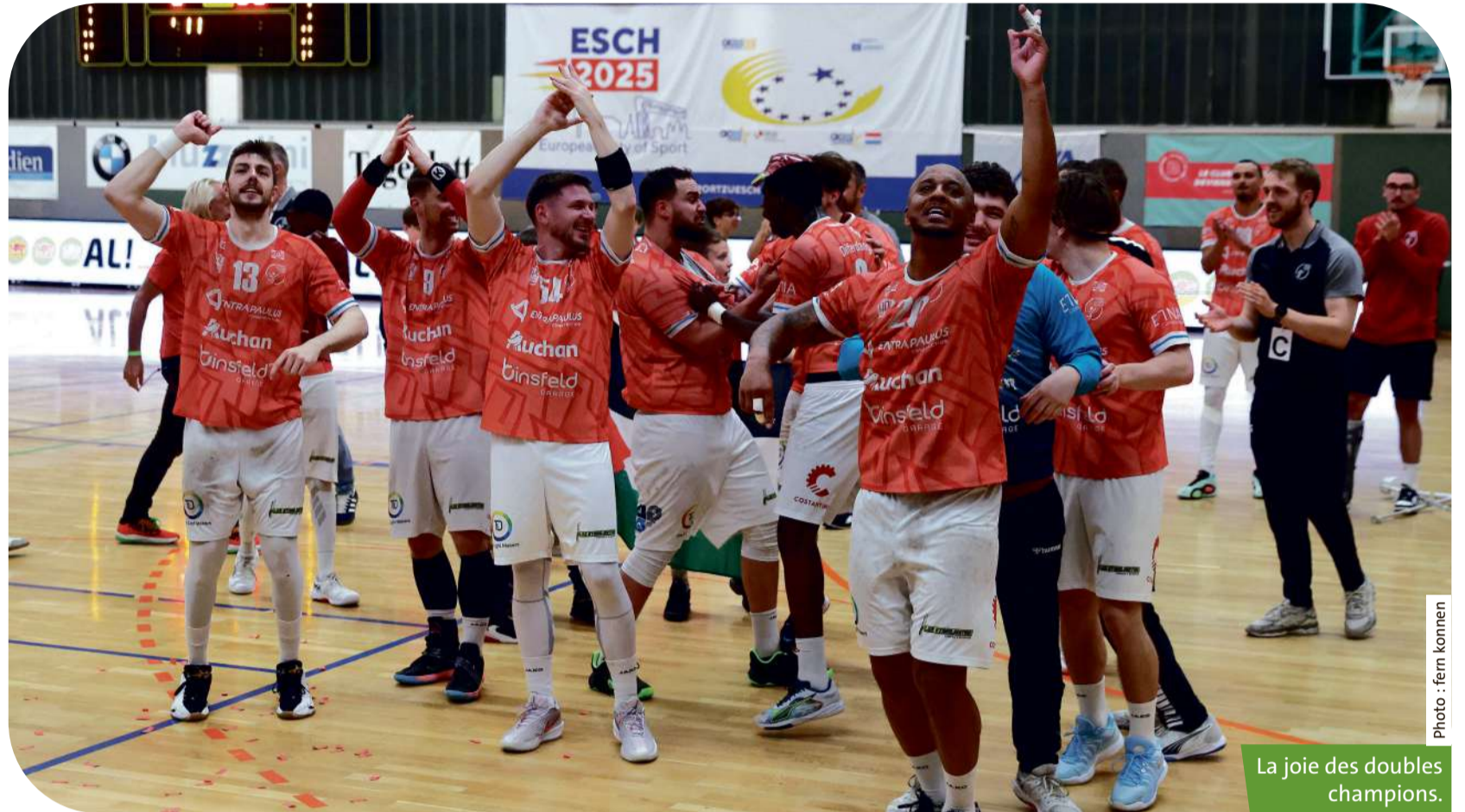
La joie des doubles champions.

Parfaite illustration à Lallange, où le pivot et ses partenaires ont fait preuve d'un sang-froid