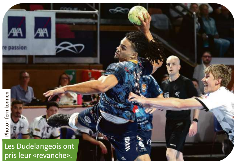
Les Dudelangeois ont pris leur «revanche».