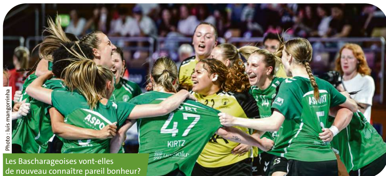
Les Bascharageoises vont-elles de nouveau connaître pareil bonheur?

Manche aller Samedi, 20 h 15 Käerjeng - Dudelange Manche retour Samedi 9 mai, 18 h Dudelange - Käerjeng Si besoin Samedi 16 mai, 18 h Käerjeng - Dudelange