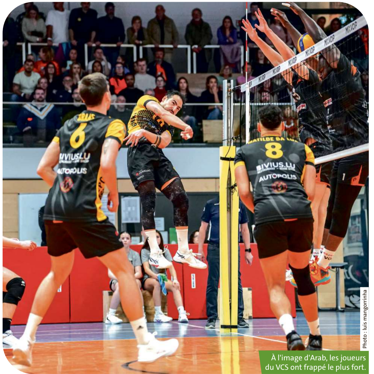
À l'image d'Arab, les joueurs du VCS ont frappé le plus fort.