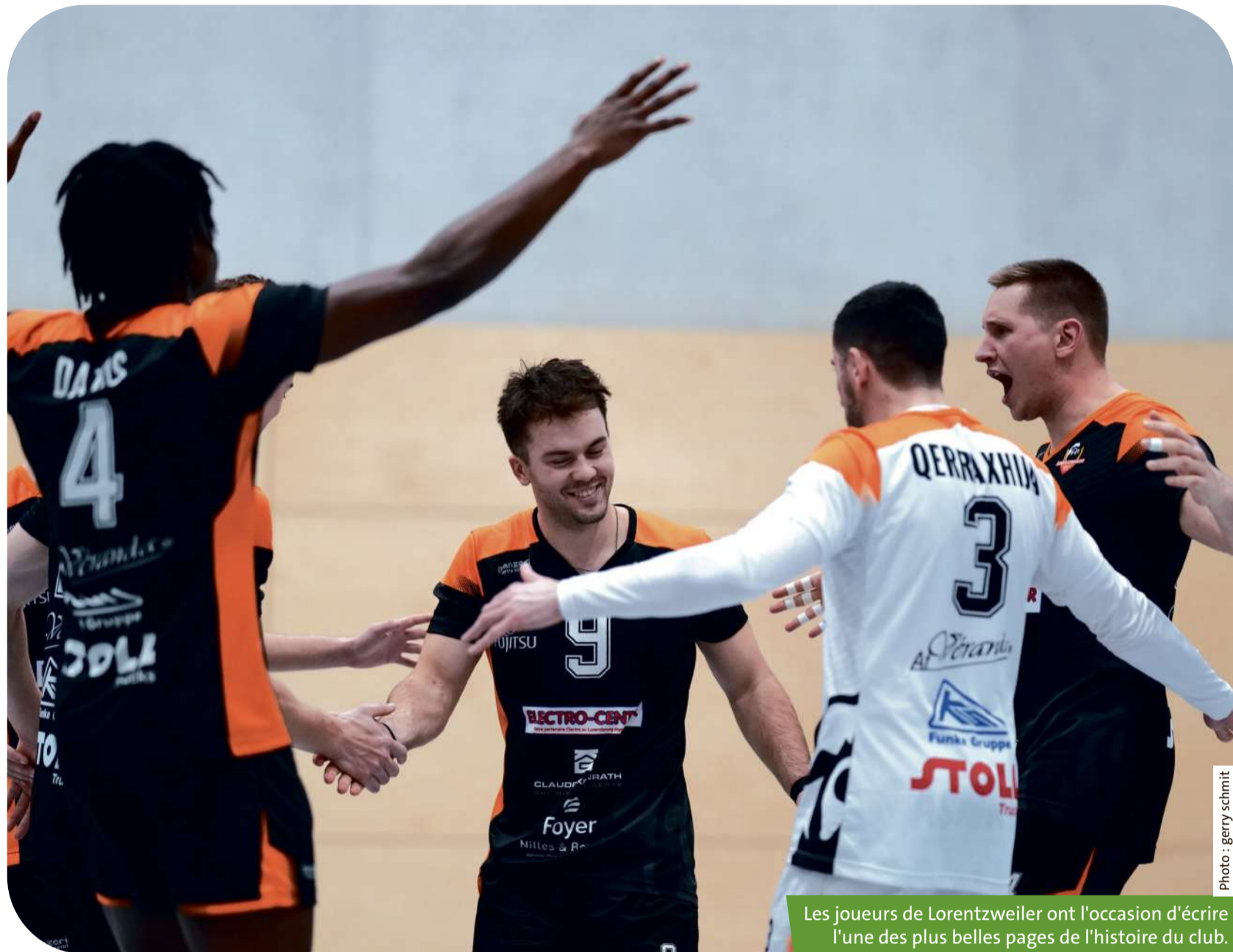
Les joueurs de Lorentzweiler ont l'occasion d'écrire l'une des plus belles pages de l'histoire du club.

Et d'ajouter: «Nous allons essayer de jouer notre meilleur volley, mais vraiment sans aucun stress.» «D'ailleurs pour la petite histoire, je sais que Strassen s'est entraîné pendant la trêve alors que de notre côté, nous avons fait un break de deux semaines, poursuit-il. J'ai envoyé les gaillards en vacances ( il rit ) afin qu'ils puissent