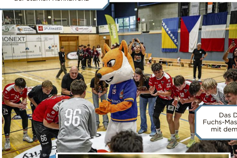
Das Düdelinger Fuchs-Maskottchen feiert mit dem Siegerteam