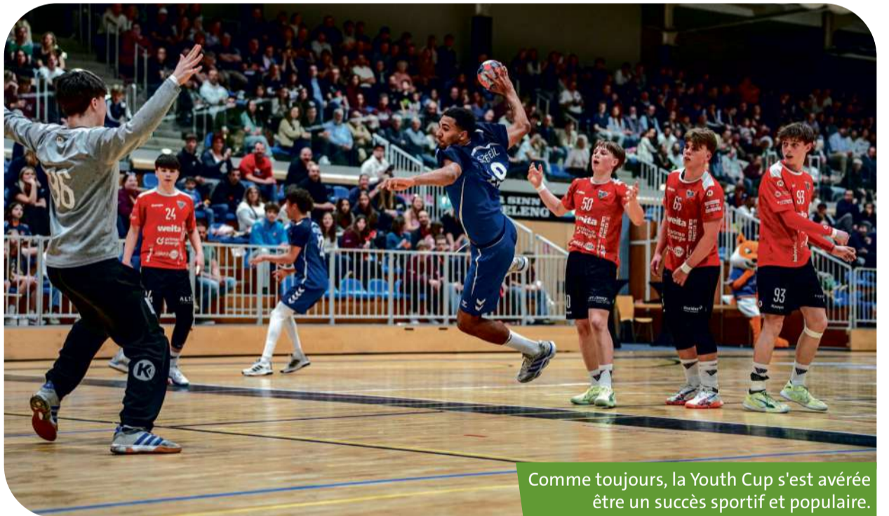
Comme toujours, la Youth Cup s'est avérée être un succès sportif et populaire.

«Cela a été une belle aventure pour cette équipe constituée de joueurs de Dudelange avec le renfort de joueurs de Bascharage et de Berchem. On est vraiment satisfait de son comportement. Les joueurs ont montré beaucoup de volonté, ce qui nous a permis de battre une académie comme Créteil, finaliste du tournoi, lors des matches de poules. Pour ces jeunes joueurs, c'est une formidable expérience dont ils se souviendront. Ces trois jours de compétition leur ont permis de découvrir différents styles de jeu et d'évoluer aux côtés de joueurs déjà aguerris au haut niveau. Tout était plus dur que d'habitude, notamment pour marquer des buts face à d'excellents gardiens», analysent les deux coaches.