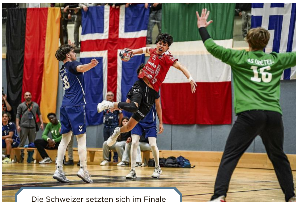
Die Schweizer setzten sich im Finale gegen Créteil aus Frankreich durch