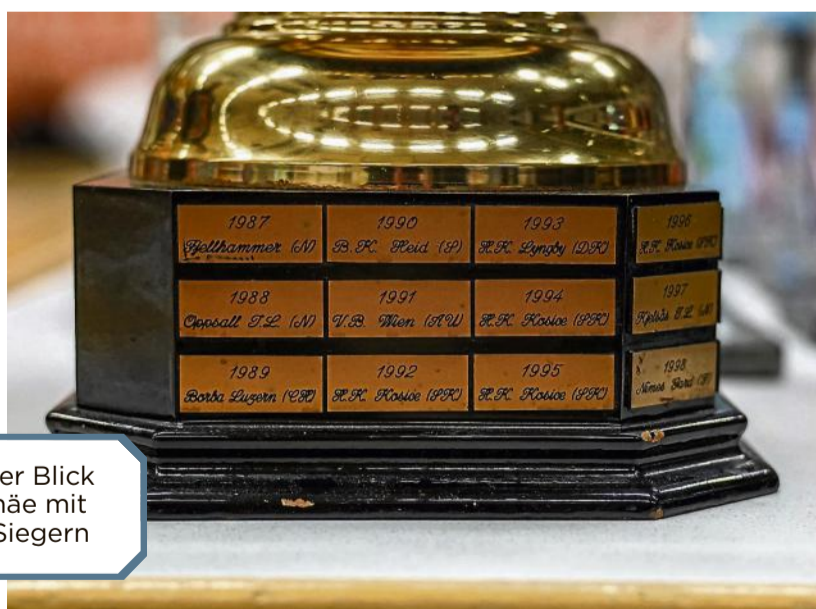
Ein detaillierter Blick auf die Trophäe mit ehemaligen Siegern