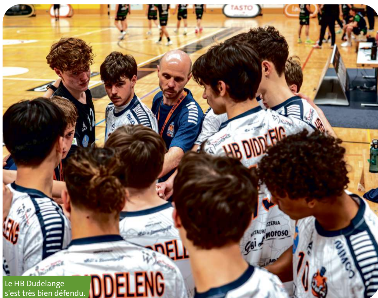
Le HB Dudelange s'est très bien défendu.