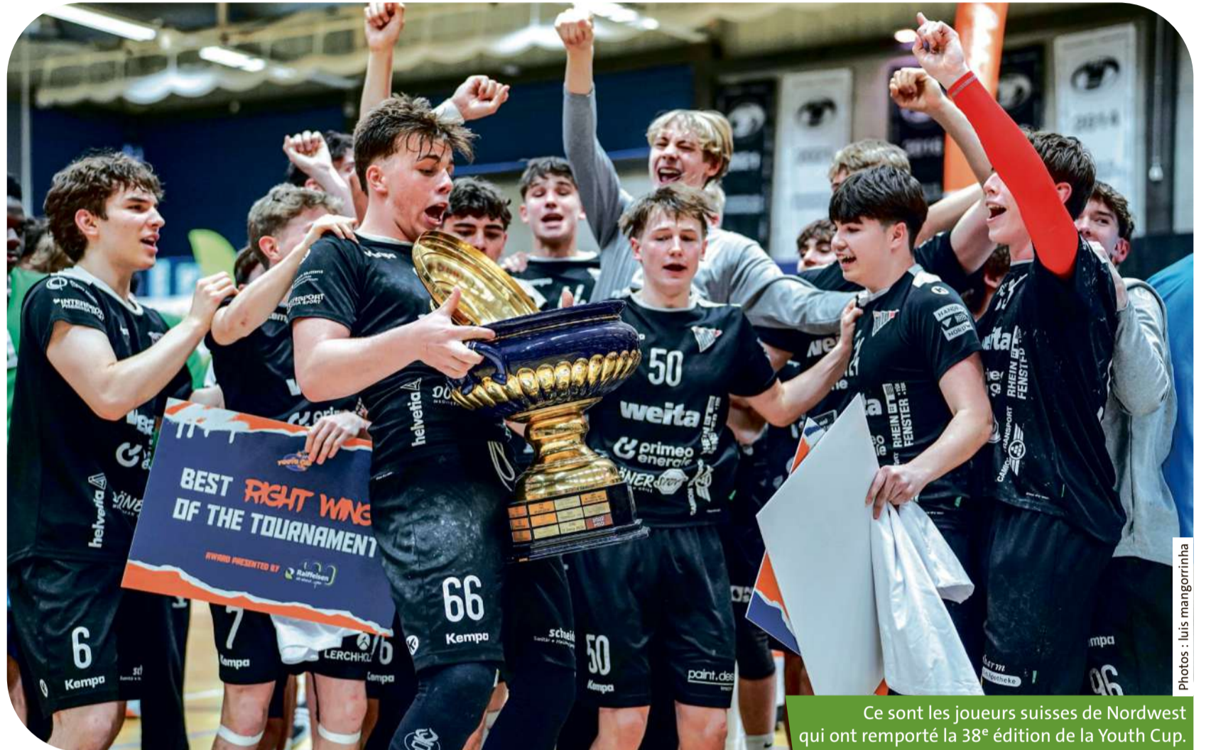
Ce sont les joueurs suisses de Northwest qui ont remporté la 38 e édition de la Youth Cup.

En ce qui concerne l'aspect purement sportif, la compétition a été d'un très grand niveau. Du côté luxembourgeois, la prestation d'ensemble a été plutôt convaincante avec une belle cinquième place décrochée par le HB Dudelange face aux Bosniens du RK Izvidac (14-11).