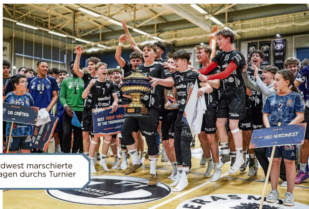
HSG Nordwest marschierte ungeschlagen durchs Turnier

Im Viertelfinale musste sich der HBD dann jedoch am Sonntag mit 16:21 dem italienischen Team Albatro Siracusa geschlagen geben und schied damit aus dem Titelrennen aus. In den Platzierungsspielen folgte zunächst ein 14:11-Sieg gegen Izvidac (BIH), ehe die Düdelinger im Spiel um Rang fünf dem isländischen Vertreter Vestmannaeyjar mit 22:30 unterlagen.