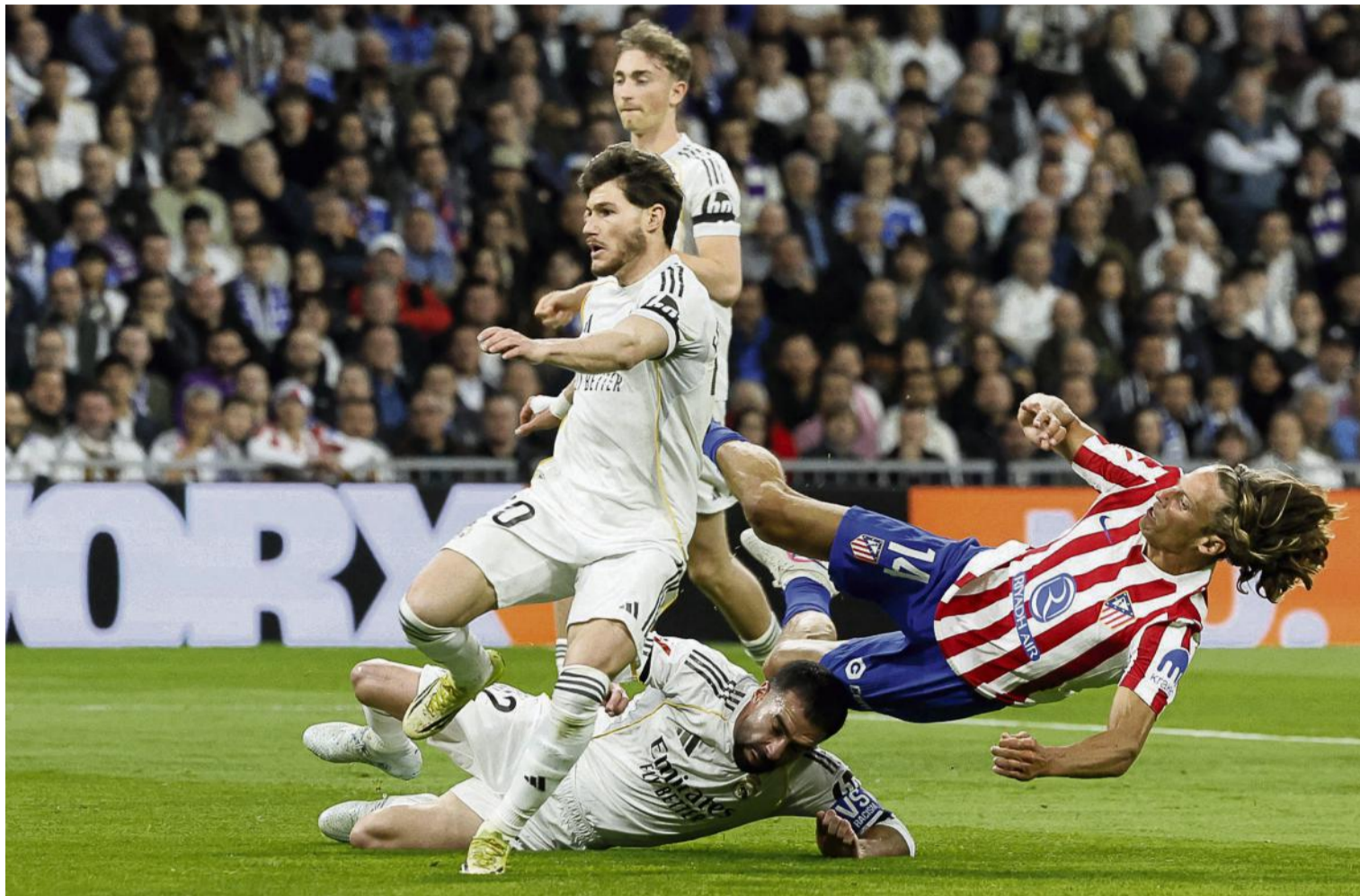
Real Madrid hat am Sonntagabend in einem hitzigen Stadtderby seine Chancen in der spanischen Fußball-Meisterschaft gewahrt. Dank eines Doppelpacks von Vinicius Junior setzten sich die Königlichen in einer packenden Partie mit 3:2 (0:1) gegen Atletico Madrid durch. Damit liegt Real als Zweiter der Tabelle weiter vier Punkte hinter Spitzenreiter FC Barcelona.