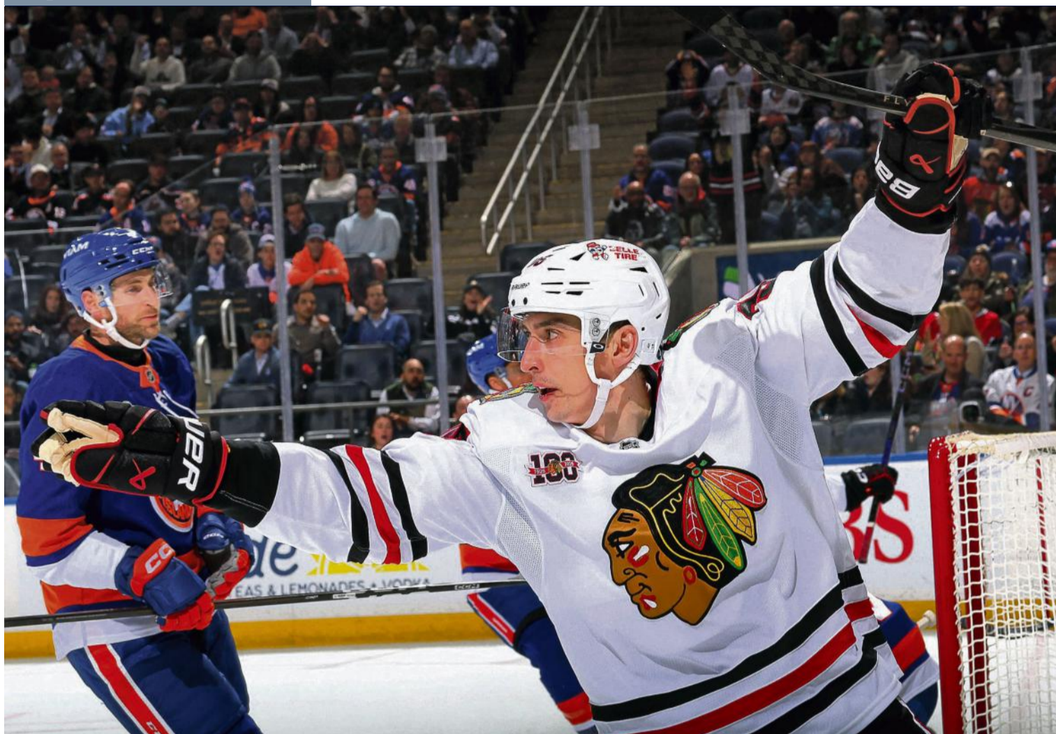
Ilya Mikheyev feierte gestern mit den Chicago Blackhawks in der NHL einen 4:3-Sieg gegen die New York Islanders

Elmont, New York