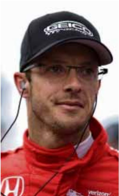
Sébastien Bourdais n'est pas resté longtemps sans volant.

pera ainsi à la prochaine saison du championnat américain d'endurance (IMSA) où il portera les couleurs l'écurie JDC Miller Motorsports, qui vient de s'associer avec Mustang Sampling Racing, et pilotera une Cadillac DPi-V.R. Il aura pour équipier le Portugais Joao Barbosa, déjà deux fois titré en IMSA. L'écurie a également recruté le Brésilien Christian Fittipaldi comme conseiller principal. L'équipage de la Cadillac sera complété par Loïc Duval lors des épreuves de la Michelin Endurance Cup. «Après deux semaines très difficiles remplies d'incertitudes sur mon avenir, je suis ravi d'avoir l'opportunité de courir à nouveau sur un prototype, a déclaré Sébastien Bourdais dans un communiqué de JDC Miller Motorsports. (...) Je tiens à remercier Christian et tous ceux qui ont rendu cela possible. (...) J'ai hâte de prendre le volant de notre Cadillac DPi-V.R.»