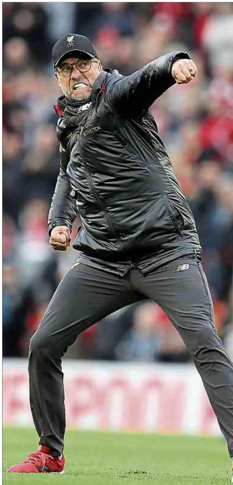
Jürgen Klopp hat in dieser Saison oft Grund zum Jubeln.

Dass seine Spieler mit Druck umgehen können, bewiesen sie nicht erst in der ersten K.-o.-Run-