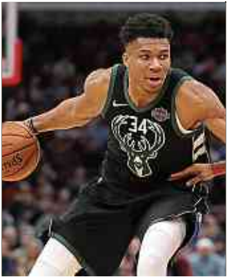
Giannis Antetokounmpo spielt eine starke Saison.

Die Boston Celtics zählten zu den großen Enttäuschungen der regulären Saison, doch Kyrie Irving und Co. haben das Potenzial, um für eine Überraschung zu sorgen. Wenn es schlecht läuft, könnte das Team von Trainer Brad Stevens aber auch schon in der ers-