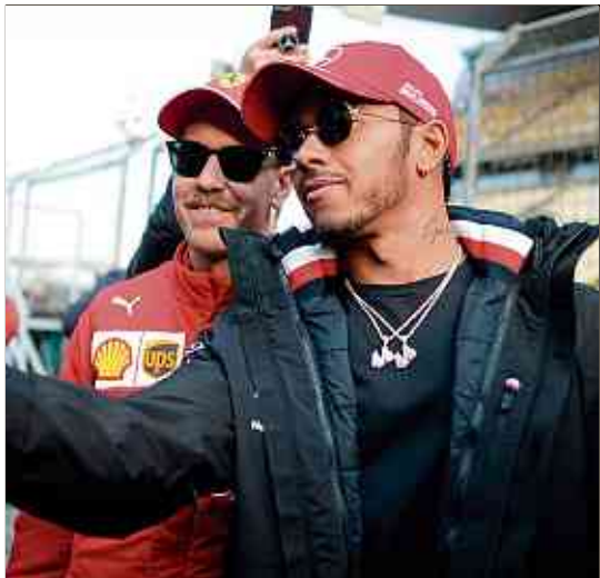
Lewis Hamilton und Sebastian Vettel (l.) sind die Feierlichkeiten ziemlich egal.

Auch die Stimmung auf den Zuschauertribünen entlang der Strecke im Nordwesten der Megametropole Shanghai ließ zum Auftakt zu wünschen übrig. Obwohl laut Veranstalter das Rennwochenende ausverkauft ist, verloren sich zu den Freitagstrainings nur wenige Tausend Zuschauer auf den Rängen. Anders hätte das gewiss in Silverstone (GB) ausgesehen, wo am 13. Mai 1950 das allererste Rennen stattfand – doch der Formel-1-Führung war das Risiko einer Regenschlacht in den englischen Midlands zu groß. Nun also China, das Formel-1-Boss Chase Carey am Freitag PR-trächtig als „einen der aufregendsten Orte für die Zukunft in der Formel 1“ bezeichnete.